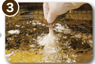
3 油に投入し、揚げます。