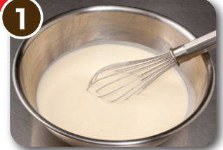
1 水に天ぷら粉を入れ、 ダマがなくなるまで良く混ぜます。