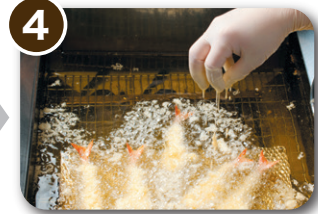
4 上から追い種します。