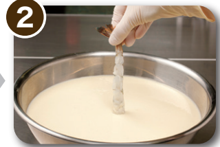
2 打ち粉はせずに、 種にバター液を付けます。