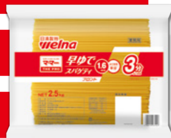
マ・マー THE PRO 早ゆでスパゲティ1.6mm