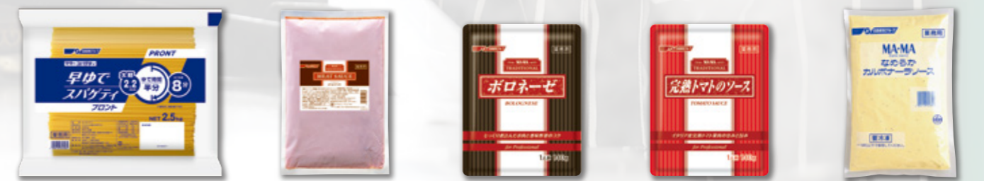
マ・マー 早ゆでスパゲティプロント2.2mm